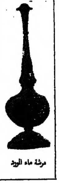
مرحة ماء الورد

والاحاديث مع رشف فناجين القهوة مع التمر. اما الرجل البدوي فأنسه يستيقظ مع الفجر ويخرج من خيمته بنفس ملابسه من غير ان يضيف اليها شيئا مهما كان الجو باردا، ثم يوقظ ما عنده من الجمال تفتق وهي ترمى وتزيد.. وينادي على صحابه.. ويستيقظ الجميع وتخرج الجمال والأرجل الخلفية مربوطة حتى لا تستطيع الهرب والابتعاد عن المكان. ثم يصلي البدوي بعد ان يتوضأ.. وبعد الصلاة يقوم بطحن القهوة في هون - هون من النحاس ثم يقوم الرجال بتبشيرة خبز الصباح هذا اذا كانوا بنون السفر وحدهم مكرين والا فان النساء يقمن بهذا العمل.. وبعد تناول الإفطار جماعة، يشربون الشاي غير المزوج بالطيب.. وبعد الشاي يشربون القهوة السوداء المركزة بدون سكر - المرة - وشرب القهوة العمانية فن له تقاليد.. وكما انهى الشارب ما يفنجانه من القهوة وهي لا تزيد عن قطرات قليلة. عاد حامل القهوة يصب له من جديد الى ان يرتوي ويكتفي. وعند ذلك يحرك الفجان حركة خاصة تدل على انه قد نال كفايته، ولا بد ان يكون هذا باليد اليمنى. واذا ذهب مع اسرتك لزيارة بيت في سلطنة عمان فنوف يقودونك الى المجلس او ديوان الرجال، بينما تذهب زوجتك الى قسم الحريم وهو المكان المخصص للنساء. والقهوة لا تعني مجرد ذلك السائل المعروف، بل قد تعني وجبة طعام كاملة كبيرة وقد تشمل هذه الوجبة الشاي والفاكهة واللحم والطوى.. فالعماني لا يذكر لك حيس يدعوك الى بيته انه سيقدم من طعاما جيدا فهو يخجل من ذكر الطعام او وصفه او التمدح في الواعه.. حتى بعد